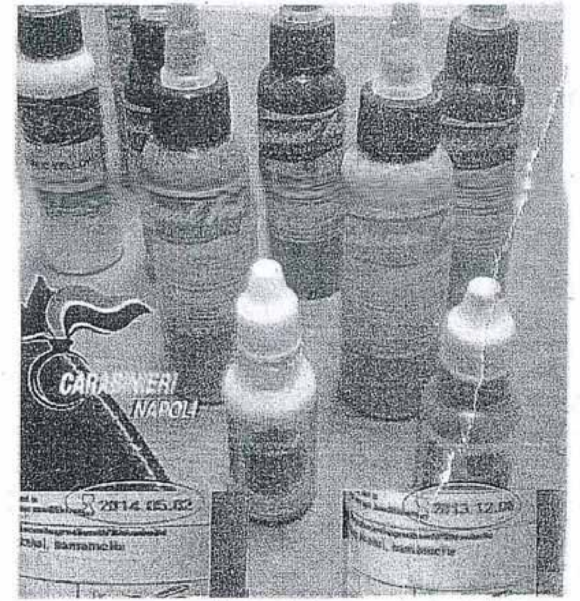
Sotto sequestro Il materiale recuperato dall'Arma

Il sindaco alla maggioranza: «L'unica fibrillazione sia quella di lavorare». Valente: «Organizzo l'opposizione, il Pd non c'entra»