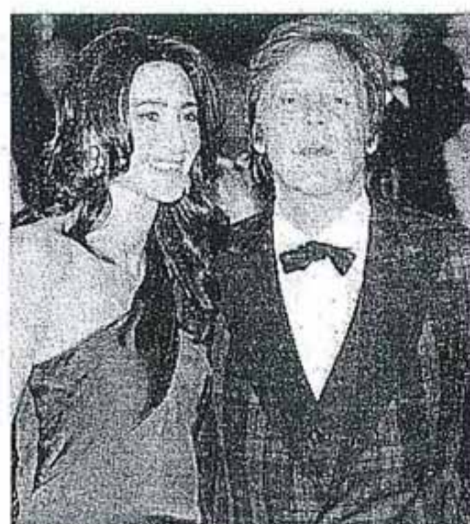
Coppia Paul e la moglie Nancy in occasione di una cerimonia

Un baronetto a Capodichino: sir Paul McCartney è sceso ieri a Napoli, ore 17.07, da un volo privato in arrivo da Lydd, alias l'aeroporto di Londra-Ashford. Era in compagnia di Nancy Shevell, la terza moglie. In rete correva una domanda: semplice vacanza (con quale destinazione?) magari in anticipo sul party kolossal di Dolce & Gabbana?